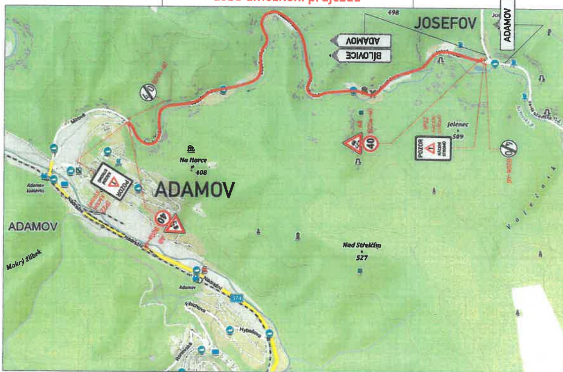
DETAIL Označení pracovního místa v době umožnění průjezdu