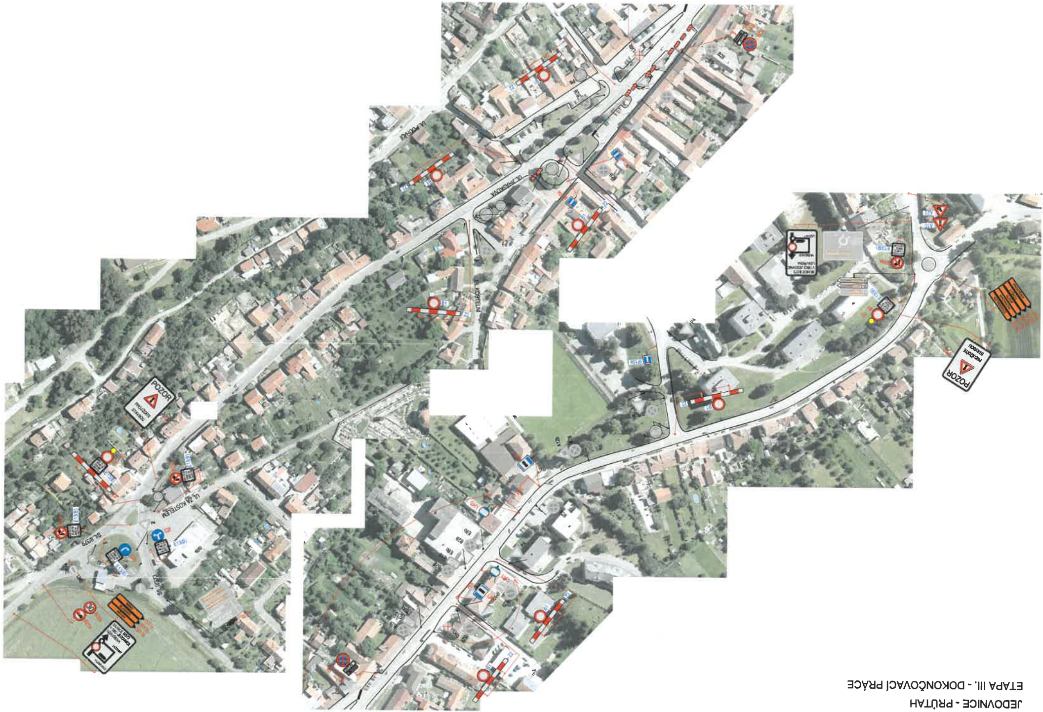
JEDOVNICE - PRŮTAH ETAPA III. - DOKONČOVACÍ PRÁCE