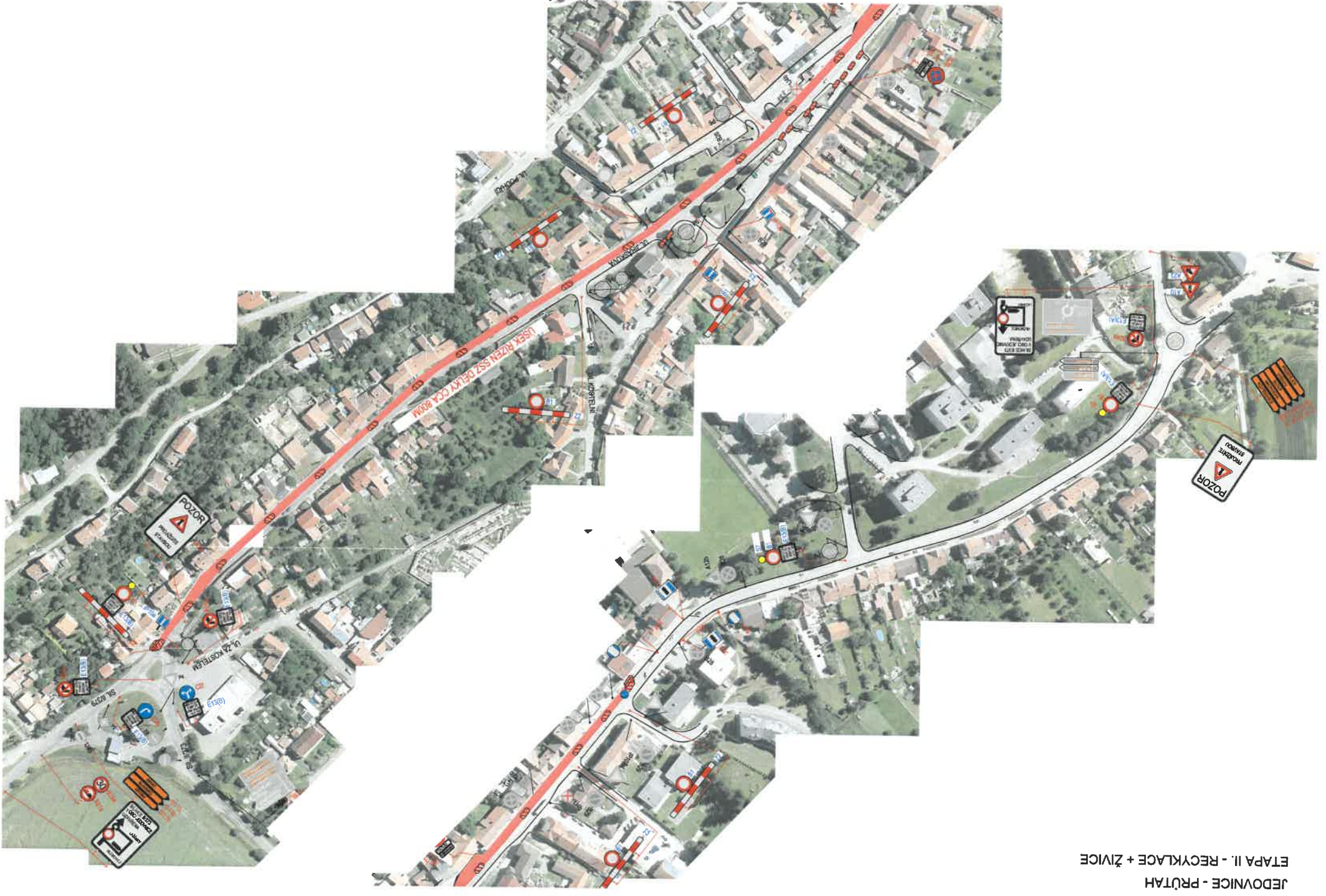
JEDOVNICE - PRŮTAH ETAPA II. - RECYKLACE + ŽIVICE