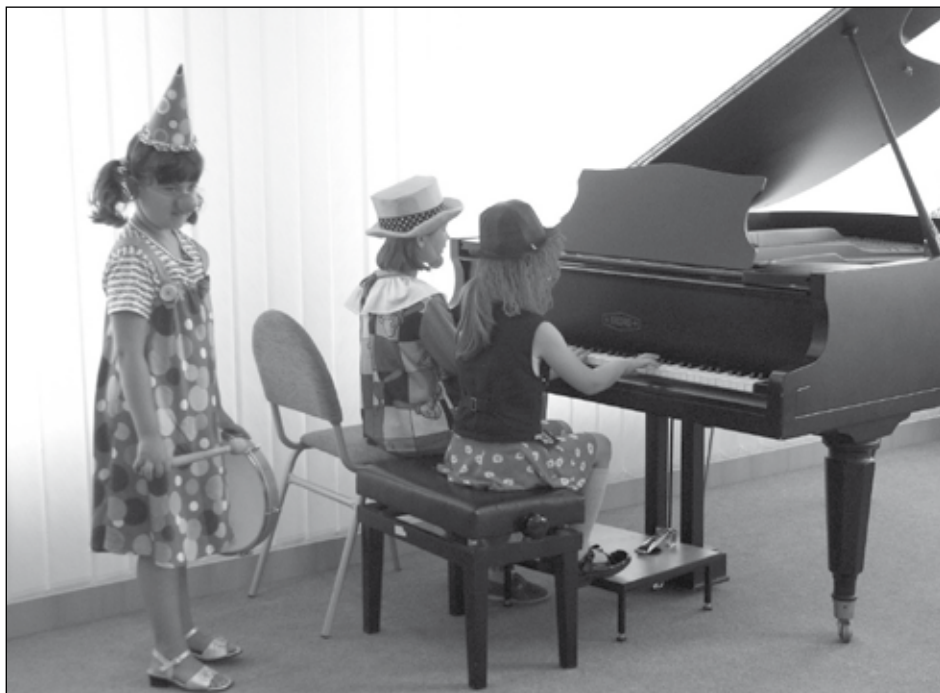
Třídní besídka malých klavíristů

V této klavírní „přípravce“ se děti již od předškolního věku, pomocí kombinace řady metodických postupů, systematicky seznamují s hrou na klavír. Moderní klavírní pedagogika naštěstí nestanovuje požadavek výchovy dětí se „zázračně rychlými prsty“, nýbrž se snaží vychovávat hudebníky, kteří správně cítí, co hrají, rozumí tomu, co hrají a hra na dané úrovni jim neklade žádné překážky. K rozvíjení těchto předpokladů se ukazuje jako nejvhodnější právě předškolní věk dítěte. Bezprostřednost a hravost jsou nepostradatelnou součástí výuky. Děti se učí základním klavírním dovednostem tak, aby je v budoucnosti nečekala za nástrojem nepříjemná překvapení. Nenásilně se seznamují