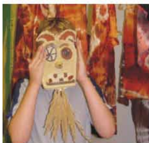
Výtvarný obor - Jedovnice: Africké inspirace