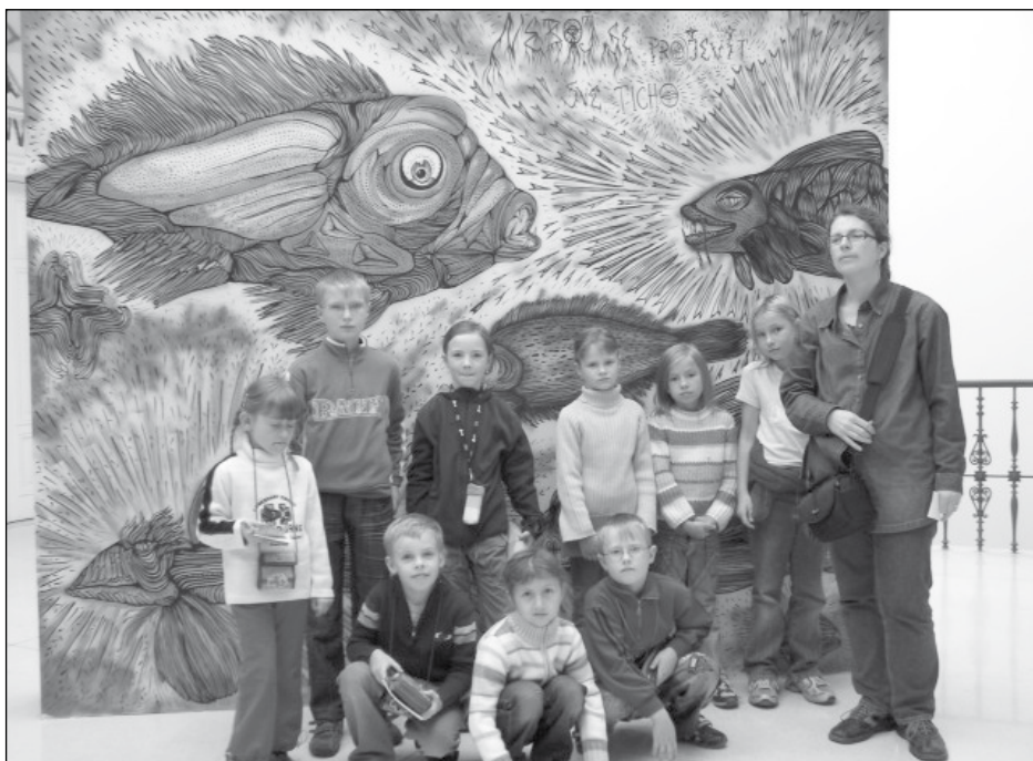
Návštěva výstavy Street Art v Moravské galerii

K největším zážitkům mladých výtvarníků patřilo pozvání úspěšných tvůrců na slavnostní vyhlášení výsledků soutěže „Bude mít Země bílou čepici?“ do Prahy na Ministerstvo zahraničí ČR v červnu 2007