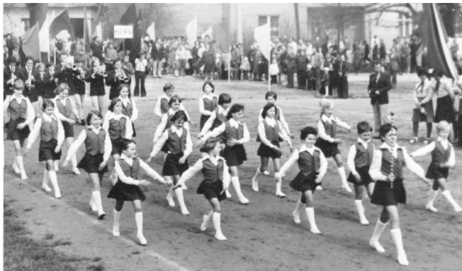
Jedovnické mažoretky v polovině osmdesátých let