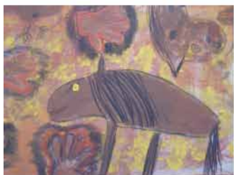
Výtvarný obor - Lipovec: Pravěk, Včely, Moře