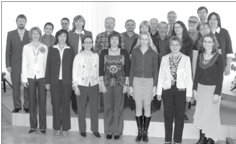
Současný pedagogický sbor

Vzhledem k velmi dobrým výsledkům školy a výraznému převisu poptávky po uměleckém vzdělávání se počátkem roku 2009 podařilo po dlouhotrvajících jednáních získat povolení MŠMT k navýšení celkové kapacity školy o 55 žáků. Toto rozšíření se dotkne výtvarného a tanečního oboru. Od školního roku 2009/2010 tak celkový počet žáků ZUŠ Jedovnice dosáhne čísla 459. Z tohoto počtu připadne 340 žáků na hudební a 119 žáků na výtvarný a taneční obor.