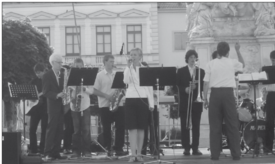
Promenádní koncert tanečního orchestru ve Vyškově v červnu 2008