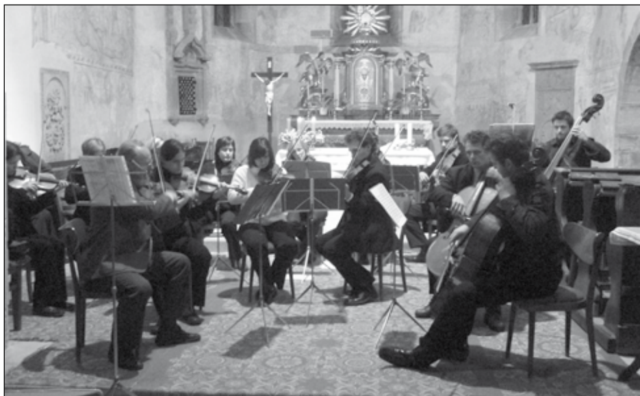
Komorní orchestr MUSICA NOVA